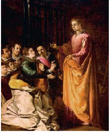
Francisco de Herrera el Viejo, Aparición de Santa Catalina a la familia de San Buenaventura . Greenville, Bob Jones University Collection