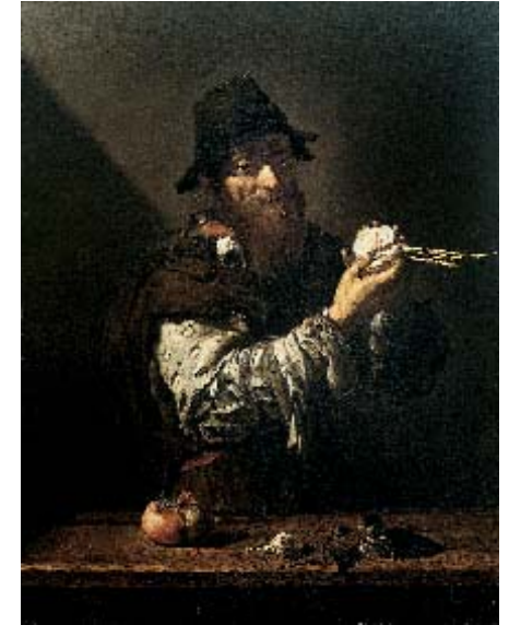
José de Ribera, El Olfato . Colección Juan Abelló

La presencia de obras de los seguidores de Caravaggio, de José de Ribera y de Tristán en Sevilla está atestiguada por textos y documentos. Especialmente significativas son las palabras de Pacheco que incluso, al final de su vida, subrayó su fidelidad al naturalismo y llegó a inspirarse en Ribera, al igual que Herrera el Viejo. De ello hemos traído varios ejemplos, como es La Coronación de espinas de Pacheco, que enlaza directamente con la de Ribera de la colección de la Casa de Alba.