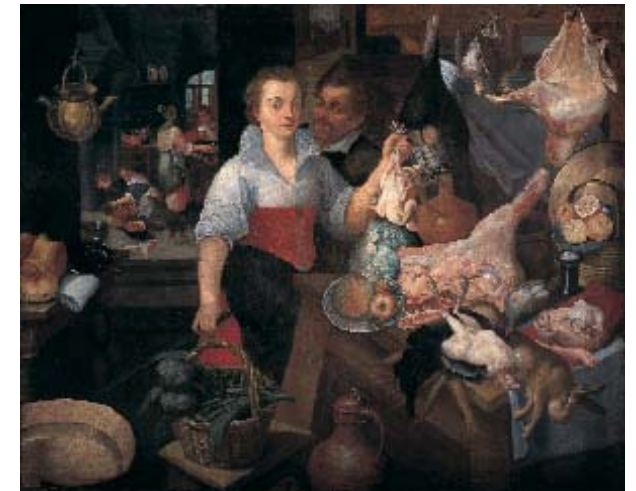
Círculo de Pieter Aertsen, Bodegón de cocina . Sevilla, Palacio Arzobispal

La llegada a Sevilla, como al resto de España, de obras o copias de Caravaggio —el artista que renovó la pintura italiana con su violenta utilización del natural y su empleo de luz dirigida, que provocaba rudos contrastes de luz y sombra— y de seguidores que imitaban sus fórmulas (Borgianni, Cavarozzi, Gentileschi), produjo un impacto sobre los pintores sevillanos que se apresuraron a seguir por la senda de la fidelidad al natural y a utilizar las luces como recurso para