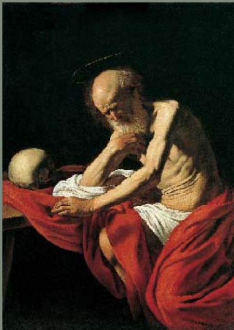
Caravaggio, San Jerónimo penitente . Museo de Montserrat (Barcelona)