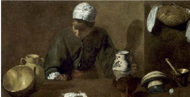
Diego Velázquez, La mulata . The Art Institute of Chicago, Robert Waller Memorial Fund (1935.380)

subrayar el volumen de los cuerpos recortados sobre un fondo oscuro. El joven Velázquez funde, en algunas de sus composiciones juveniles, ese impacto «tenebrista» con otros elementos presentes en Sevilla desde tiempos muy anteriores: los modelos flamencos de ciertos pintores de la segunda mitad del siglo XVI que mostraban elementos de naturaleza muerta, cocinas y mercados en primer término, y que el pintor sevillano pudo estudiar en la Galería del Prelado del Palacio Arzobispal de Sevilla. Estos modelos, tratados con la luz caravaggista, están detrás de lienzos como el Almuerzo , La mulata o Los músicos . Pero también los artistas españoles viajeros a Italia traen con sus obras, ecos de lo visto allí y han de ser tenidos en cuenta para entender el cambio que se opera en la pintura sevillana a partir de 1615-20. Luis Tristán y José de Ribera, que viajaron juntos a Roma entre 1607 y 1611, son otro de los componentes que hay que tomar en consideración para comprender a los grandes