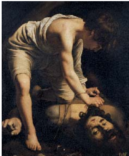
Caravaggio, David vencedor de Goliat . Madrid, Museo Nacional del Prado

subrayar el volumen de los cuerpos recortados sobre un fondo oscuro. El joven Velázquez funde, en algunas de sus composiciones juveniles, ese impacto «tenebrista» con otros elementos presentes en Sevilla desde tiempos muy anteriores: los modelos flamencos de ciertos pintores de la segunda mitad del siglo XVI que mostraban elementos de naturaleza muerta, cocinas y mercados en primer término, y que el pintor sevillano pudo estudiar en la Galería del Prelado del Palacio Arzobispal de Sevilla. Estos modelos, tratados con la luz caravaggista, están detrás de lienzos como el Almuerzo , La mulata o Los músicos . Pero también los artistas españoles viajeros a Italia traen con sus obras, ecos de lo visto allí y han de ser tenidos en cuenta para entender el cambio que se opera en la pintura sevillana a partir de 1615-20. Luis Tristán y José de Ribera, que viajaron juntos a Roma entre 1607 y 1611, son otro de los componentes que hay que tomar en consideración para comprender a los grandes