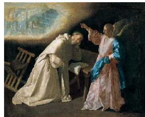
Francisco de Zurbarán, La visión de San Pedro Nolasco . Madrid, Museo Nacional del Prado

Todos estos componentes están presentes en los maestros de la generación nacida en el umbral del 1600, como Velázquez, que nace en 1599, Zurbarán en 1598 o Cano en 1601. Las semejanzas entre ellos son tantas, en esos años que van de 1615 a 1625, que la atribución de muchas obras de calidad, de estilo indudablemente sevillano, ha oscilado entre ellos y aún permanece problemática en algunos casos. Será más adelante, a partir de 1625-30, cuando se perfilarán sus personalidades independientes y cuando avancen en una senda mucho más barroca y recargada, en la que la experiencia naturalista permanece como un ingrediente más, testigo de la asimilación de un lenguaje que cambió el rumbo de la pintura española.