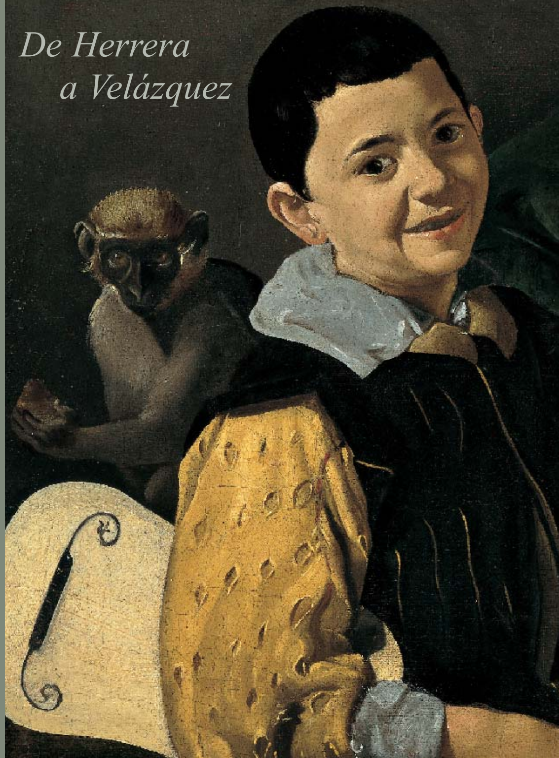
Diego Velázquez, Los músicos (detalle). Berlín, Gemäldegalerie, Staatliche Museen zu Berlin