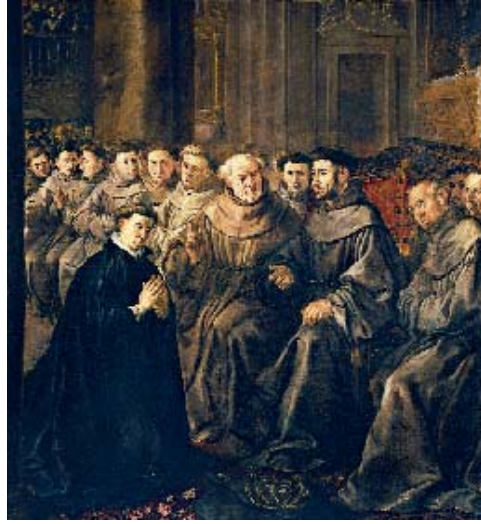
Francisco de Herrera el Viejo, San Buenaventura recibe el hábito de San Francisco . Madrid, Museo Nacional del Prado

Otros artistas más retardatarios, como es el caso de Francisco de Herrera el Viejo, a pesar de ser de una generación anterior, formado en la retórica del Manierismo, queda anclado en un pseudonaturalismo incipiente, aunque él mismo fue un fermento para la generación de los grandes maestros.